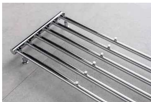
Praktyczne wieszaki na ręczniki lub płaszcz kąpielowy