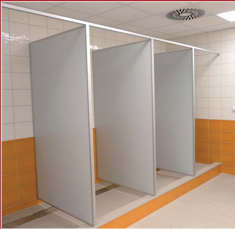
sestava sprchových stěn WF32