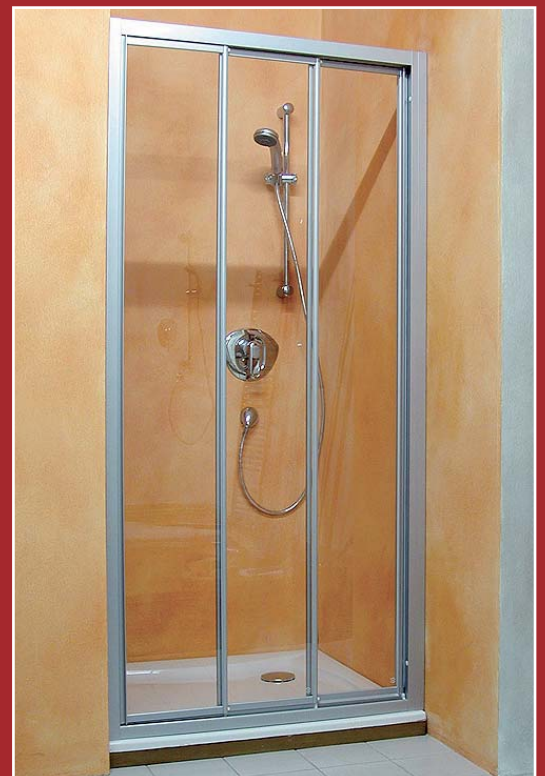
sprchová zástěna Palme Ultra