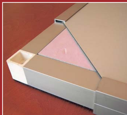
detail skladby sendvičové desky WF32