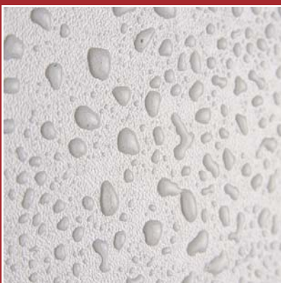
desky jsou vhodné do mokra

Je možno ho doplnit posuvnými sprchovými zástěnami s polykarbonátovým sklem s masivním hliníkovým rámem.